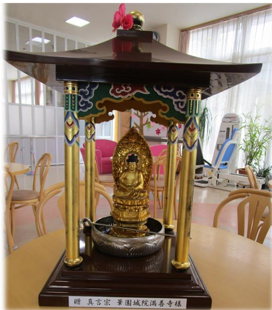
花園院満善寺より寄贈頂きました